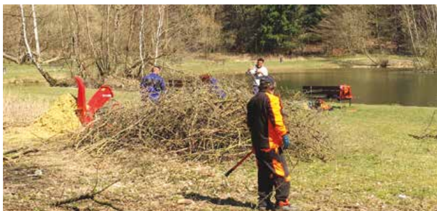
Fotodokumentace byla pořízena v březnu, a to v termínu před povinným nošením roušek.