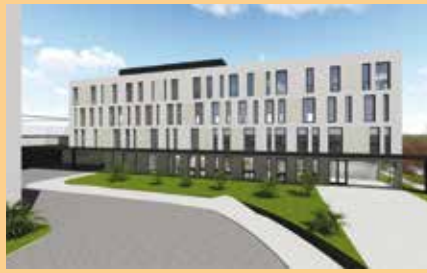
vizualizace nového pavilonu Nemocnice Šternberk

v současnosti na prvním místě, soustředíme všechny síly na to, aby se stavba realizovala a byla včas dokončena.