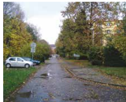
současný stav sídliště v Nádražní ulici

Státní fond rozvoje bydlení počítá s tím, že budou následovat i další výzvy, a to pravděpodobně na jaře tohoto roku. (red)